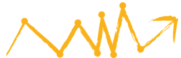
Eigene Darstellung des NÖG

Armut & Gesundheit, 22. März 2023 10:45 – 12:15 Uhr