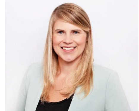
Urheber: Landesvereinigung für Gesundheit & Akademie für Sozialmedizin Niedersachsen Bremen e.V.