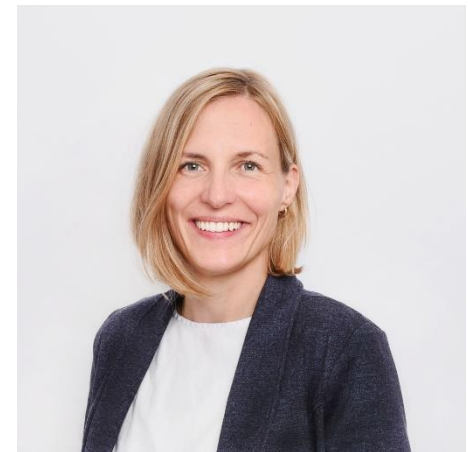
Urheber: Landesvereinigung für Gesundheit & Akademie für Sozialmedizin Niedersachsen Bremen e.V.

Website: https://www.gesundheit-nds-hb.de/projekte/gesundheit-im-quartier/